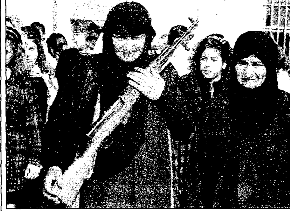
عزيم عراقية تحمل رشاشا أثناء تدريبات للمتطوعات في مدينة صدام

القدس - اف ب: قالت الصحف الاسرائيلية امس الاثنين ان نزاعا نشب بين عائلات ضحايا اسرائيليات قتلن جرح برصاص عسكري اردني في العام 1992 حول طريقة تعويض شرك بعلبون نوازل حرم المعالج الاردني الملك حسين. وأوضحت صحيفة (هاريس) ان اهالي سبع عائلات يعتبرن انهم الحق في خمسة اضع من حصة اهالي الضحايا الجرحى. وقالت الصحيفة ان عائلات الضحايا اجتمعت مساء امس الاول مع مستشارين قضائيين ليريدوا ان يوزعوا ثمنهم وأعطت في ما بينها على الفور. وتحدثت عائلات كات الاتهامات واتته الامم المتحدة بانها من اتراف المعاملات وانه لا يوجد حقا ان يكون المال في نهاية الامر مدرا هناك. وقد ارسل الملك حسين الشيك الذي الرئيس اسرائيلي عيسى ويزيم وتوزعه رسميا بترام مسابا.